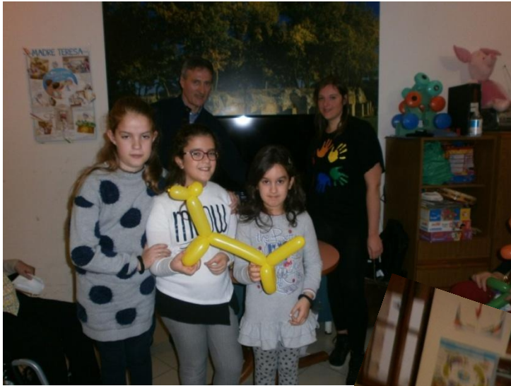
Animazione alla casa di Riposo