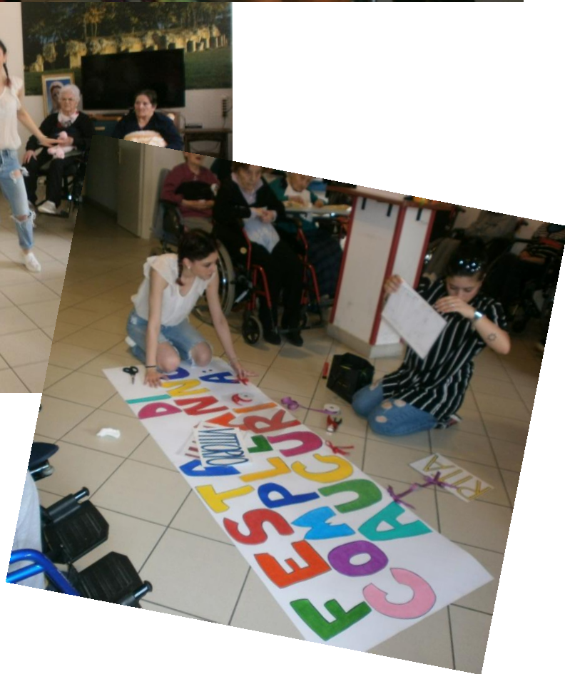
Stagisti alla Casa di Riposo e festa dei compleanni degli ospiti