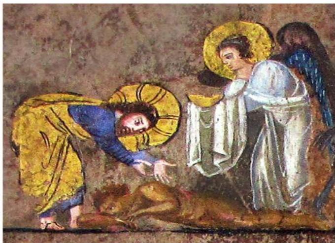
Rossano Codex Purpureo – Parabola del Samaritano

Lettera Pastorale sulla Carità 2016-2017