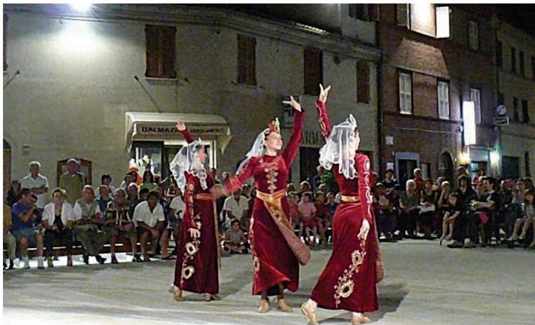
I gruppi folkloristici stranieri in occasione del Festival Internazionale del Folklore