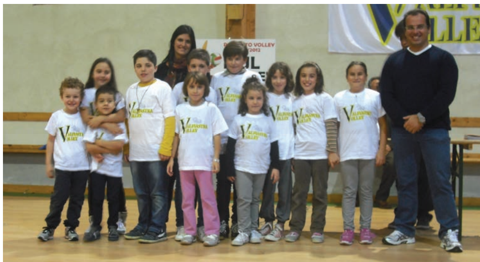
I ragazzi della pallavolo ValFiastra Volley