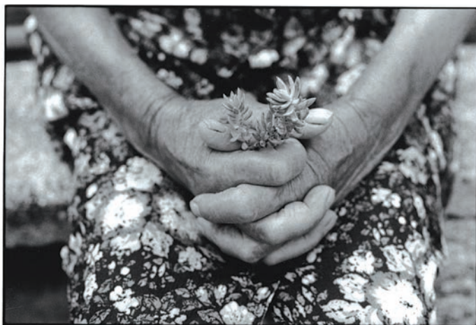
Mostra fotografica "Radici" della concittadina Paola Ciccioli (edizione 2010)