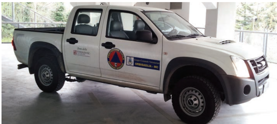
Il Pick-Up dono della Fondazione Carima