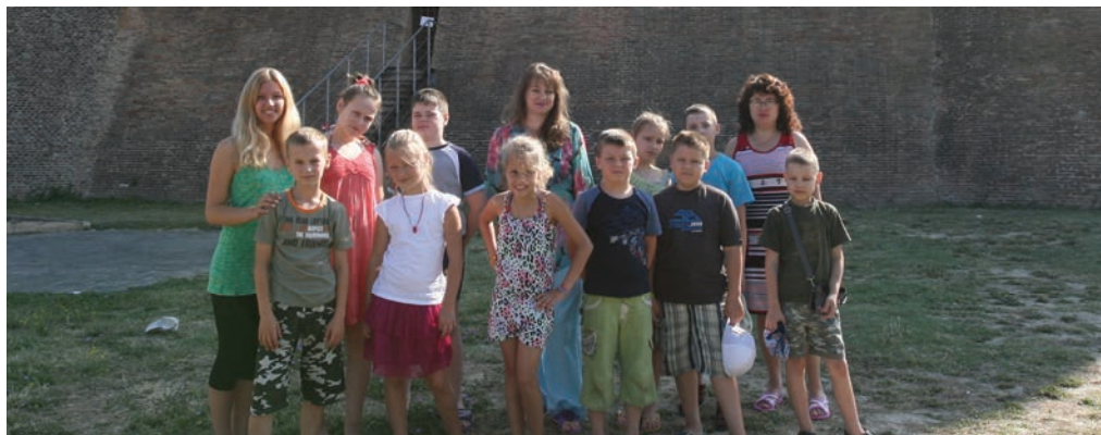
Il progetto Bielorussia insieme all'Avulss