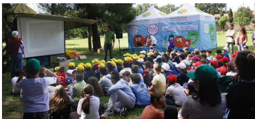
Collaborazione con le scuole per attività di approfondimento scolastico ed extra scolastico (Progetto Oro della Terra a tavola)