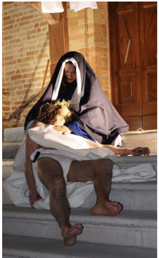
La Passione insieme al Centro Parrocchiale