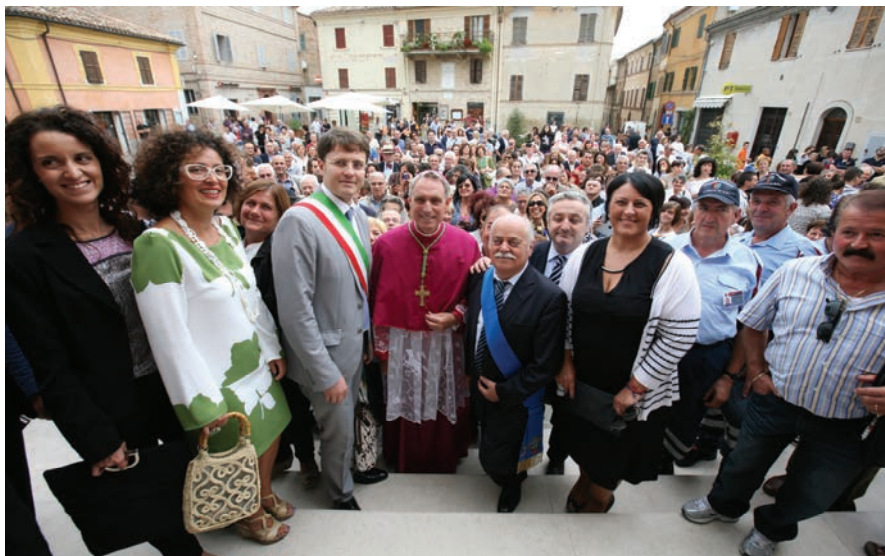
La visita dell'Arcivescovo di Urbisaglia insieme a tutte le associazioni