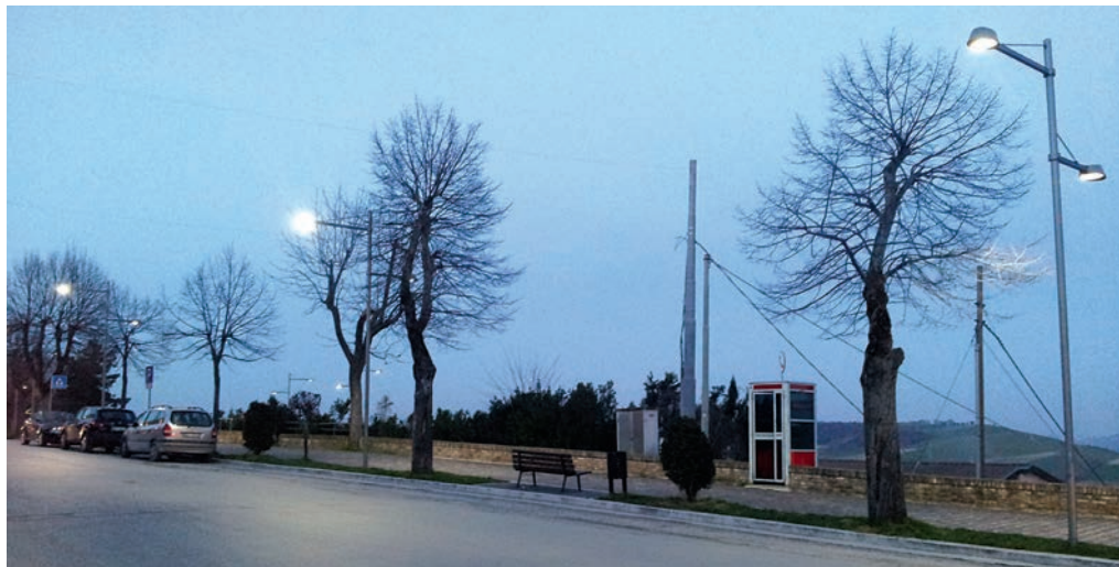
L'illuminazione a led della passeggiata di Levante

coperti con fondi non comunali. La presente iniziativa ha rappresentato una concreta politica volta al risparmio energetico.