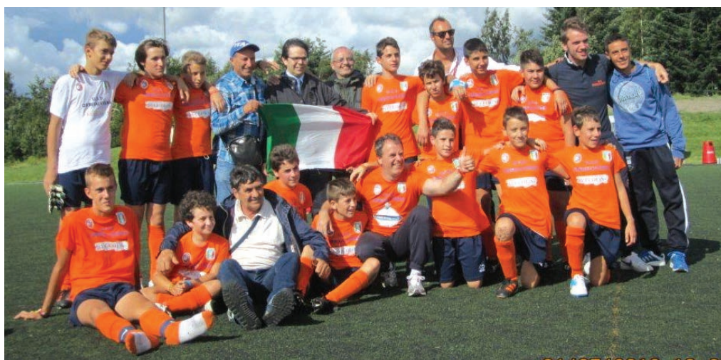
Il progetto Norway cup a Oslo insieme a U.S.D. Urbisalviense