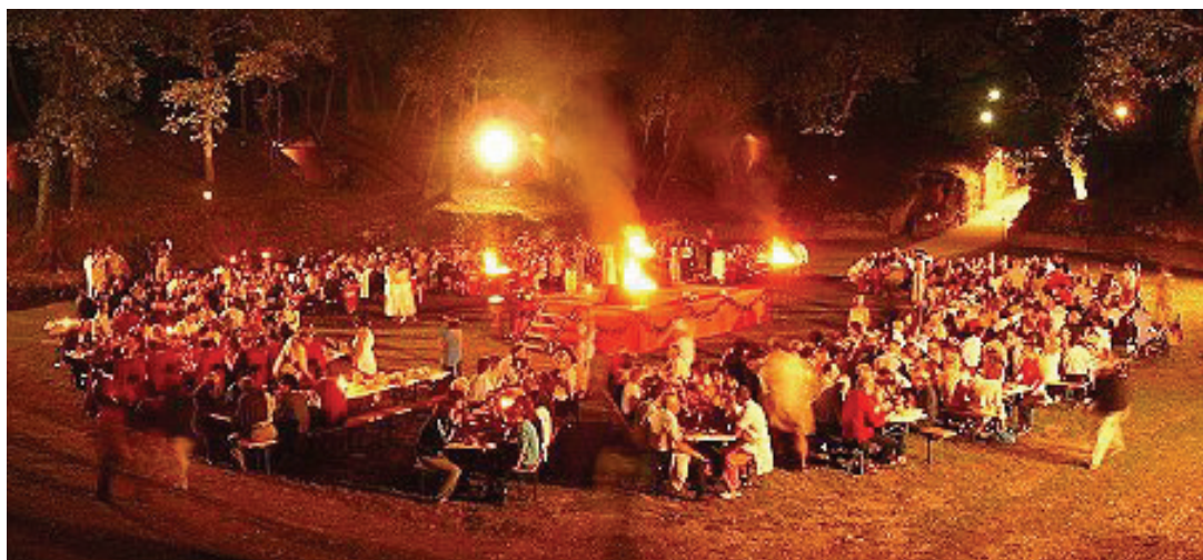
Cena Romana con Pro Loco

Tra le varie attività culturali da ricordare la nascita della Biblioteca Comunale di Urbisaglia, inaugurata il 13 luglio 2013 e situata all'interno dell'edificio Alessandro Giannelli. Numerose le iniziative avviate da questa nuova realtà, tra cui l'adesione al progetto "Nati per leggere", che si prefigge di promuovere l'attitudine alla lettura nella popolazione