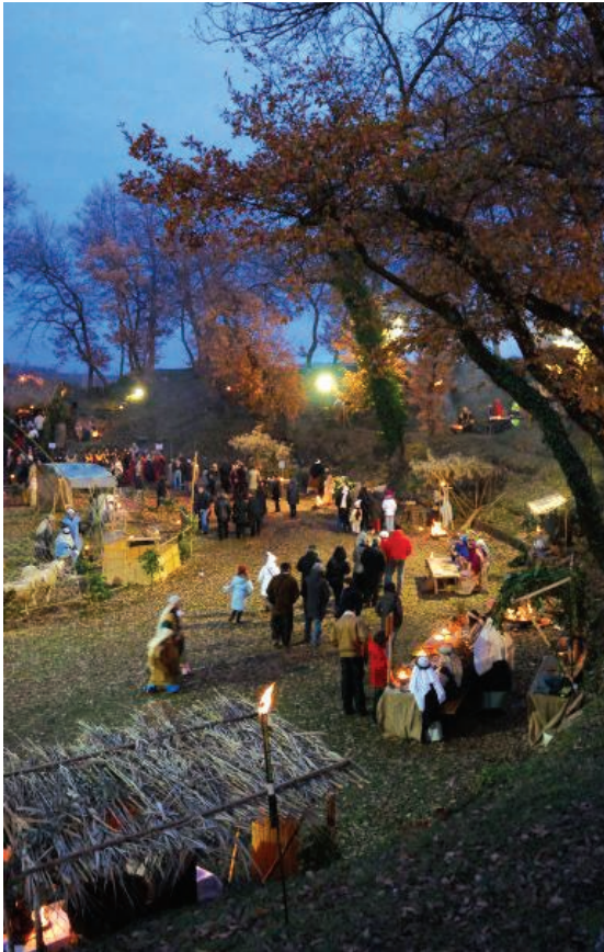
Il Presepe Vivente con la Pro Loco

Allo stesso tempo, fondamentale è stata la riproposizione delle feste tipiche degli urbisagliesi, vale a dire la Festa del Primo Maggio e La Festa di San Martino, e di tutte le altre iniziative che si sono ripetute nel corso degli anni; entrando nei dettagli, nel periodo natalizio, consueto è stato l'appuntamento con i mercatini di Natale, con il Presepe vivente (che dal Parco Archeologico si è "trasferito" in versione ridotta, negli ultimi anni, nel centro storico, grazie soprattutto all'Avulss), con le tombolate a teatro e con la discesa della Befana dalla Rocca, per la quale è stato necessario il contributo dei Vigili del Fuoco di Macerata. A seguire, poi, il Carnevale dei bambini, gli spettacoli per la Festa della Donna, la Passione di Gesù, organizzata insieme al centro parrocchiale, e la Cena Romana.