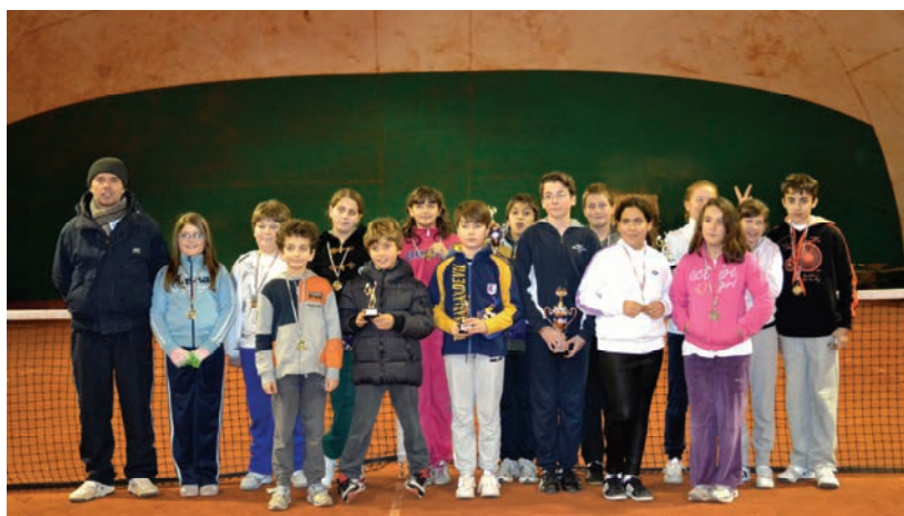
La struttura per il tennis insieme all'A.S.D. Urbisaqlia Tennis