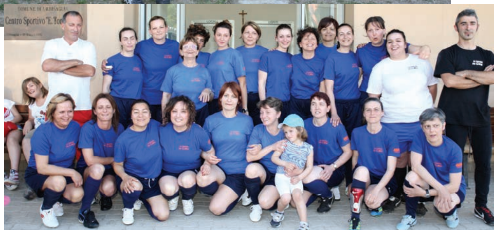
Donne nel Pallone insieme all'Avulss e alla Pro Loco