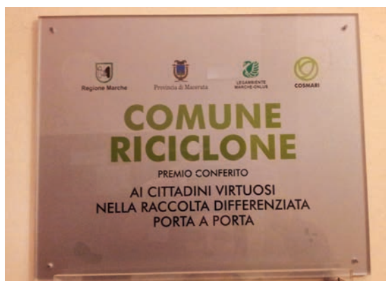
Riconoscimento “Comune Riciclone”

Il Comune di Urbisaglia ha ricevuto per 5 anni consecutivi il premio Comuni Ricicloni per la Regione Marche per aver raggiunto percentuali di raccolta differenziata ben superiori alla media nazionale del 65% e nello specifico, per aver superato abbondantemente il 75%. In questi ultimi mesi inoltre, la percentuale è cresciuta ancora: abbiamo infatti raggiunto quasi l’80%! Si tratta sicuramente di un risultato positivo che non può essere considerato come un punto di arrivo, ma deve costituire uno stimolo per fare ancora meglio.