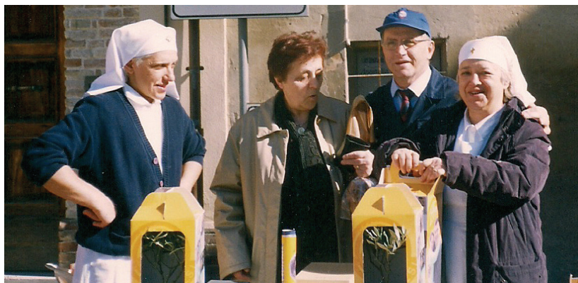
Raccolta fondi insieme all'Unitalsi